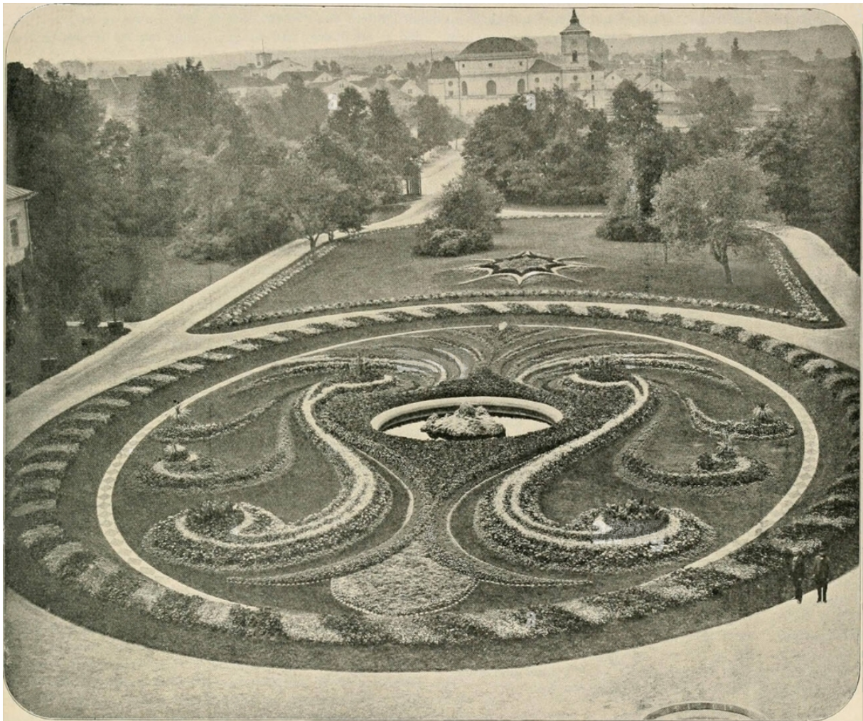
Blumenparterre im Schlofsgarten zu Skierniewize, „Die Gartenwelt“, 1897